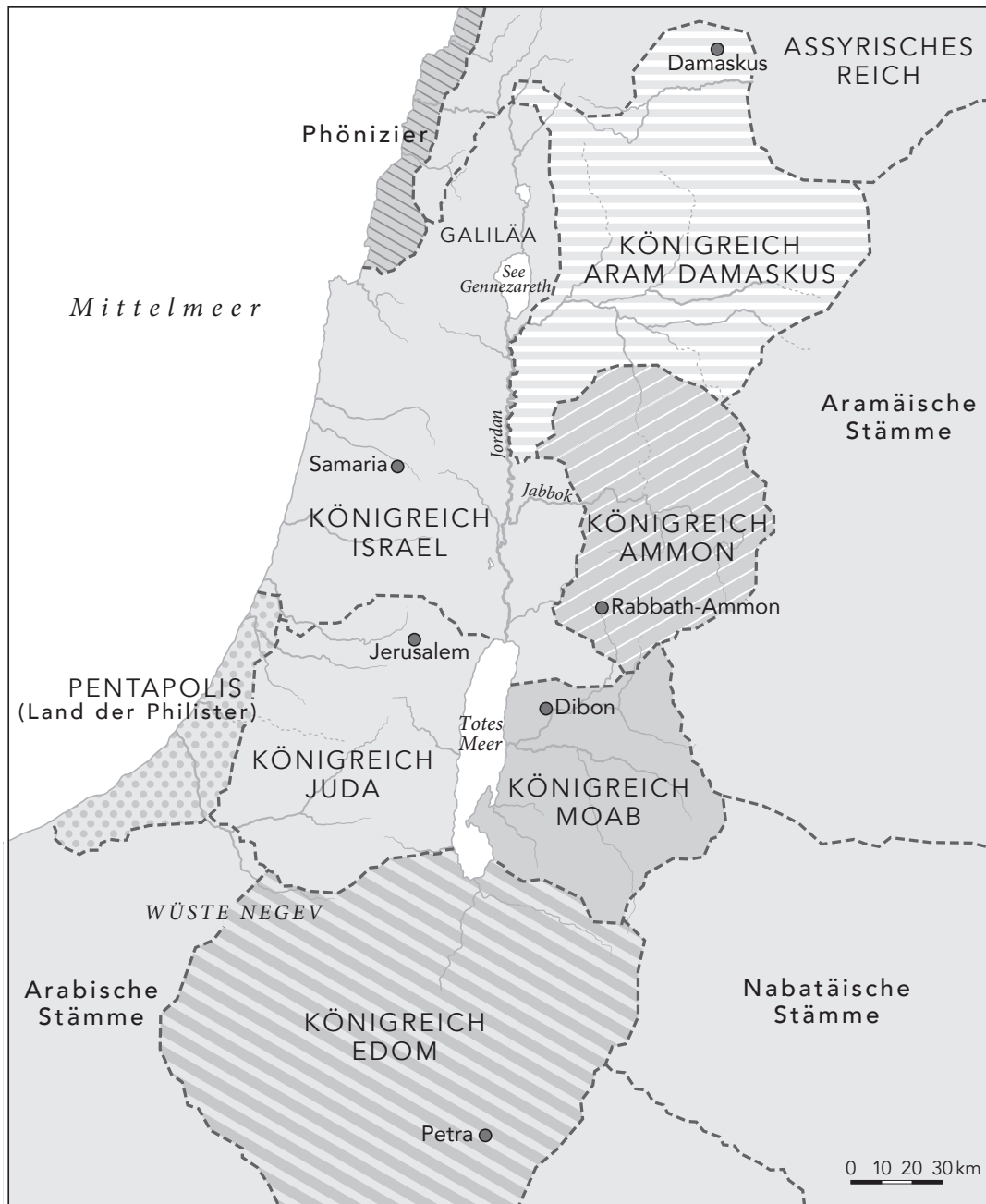
Karte 2: Kanaanäische Reiche

Reiches werden von den Assyern annektiert, 722 schließlich muss auch Samaria kapitulieren. Israels Bewohner werden in großer Zahl deportiert, fremde Gruppen im Lande angesiedelt.