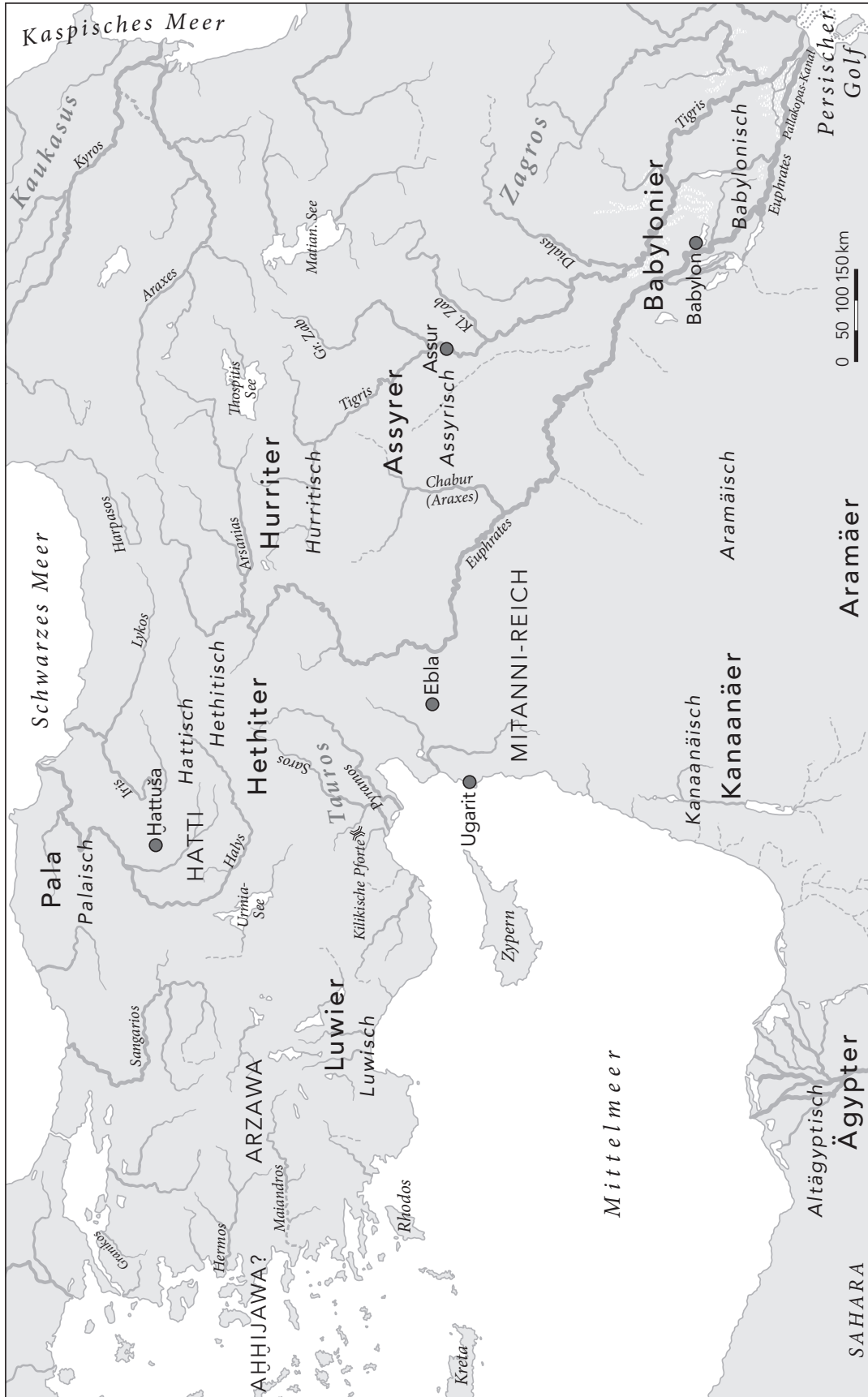
Karte 1: Völker und Sprachen der Bronze- und der frühen Eisenzeit