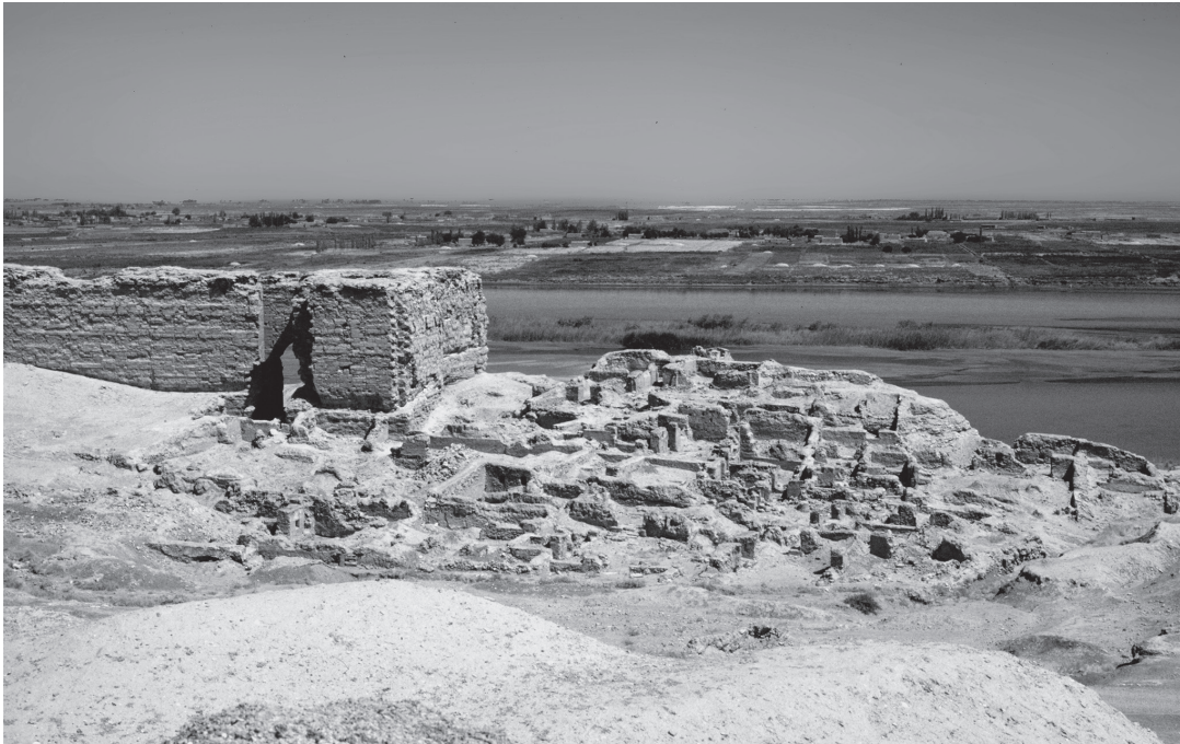
Abb. 1: Dura Europos, Syrien, Zitadelle