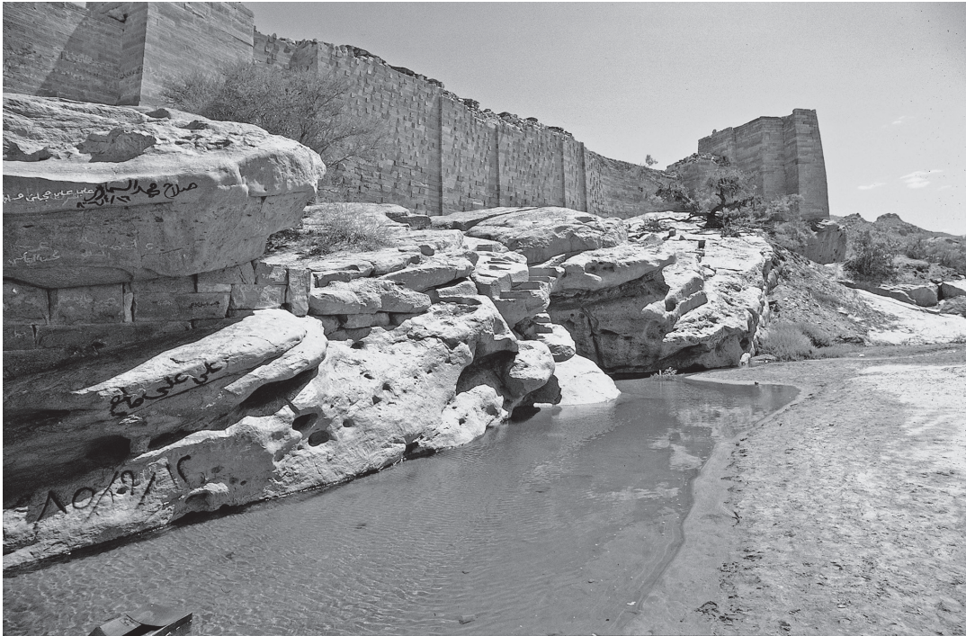
Abb. 3: Damm von Mārib, Jemen, sogenannter Südbau

Eine jüngst veröffentlichte Bronzetafel enthält den Bericht eines in militärischer Mission und als Karawanenführer weitgereisten Sabäers. Als er von Gaza aus nach Zypern übersetzte, herrschte Krieg zwischen Chaldaern und Ioniern (KŠDM und YWN). 100 Im 4. Jahrhundert v. Chr. erwähnt eine Widmungsinschrift aus Yaṭill, aufgestellt von minäischen Großhändlern, die zwischen Ägypten und Assyrien Handel trieben, einen Krieg zwischen Persien (M'Y) und Ägypten (MSR), womit vermutlich die Rückeroberung des Nillandes durch Artaxerxes III. 343 v. Chr. gemeint ist.